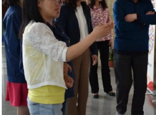
公司制作展板在办公大楼宣传