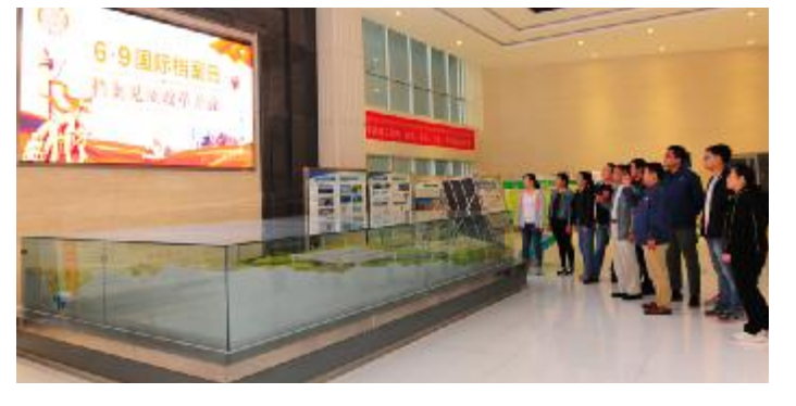
工程建设分公司大屏滚动播放宣传内容