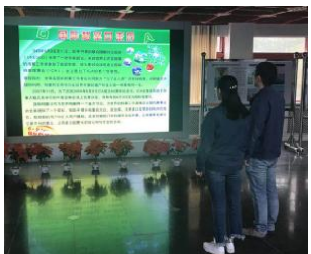
龙电分公司大屏播放宣传知识