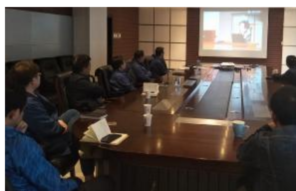
光热发电事业部集中观看宣传视频

为迎接第11个“6·9国际档案日”，宣传档案工作服务企业决策、服务公司发展、服务广大员工的重要作用，增强公司全员档案意识。公司各单位根据《省档案局关于开展2018年“国际档案日”宣传活动的通知》精神，结合情况，精心部署，周密筹划，开展了为期一周的“档案日”宣传系列活动。