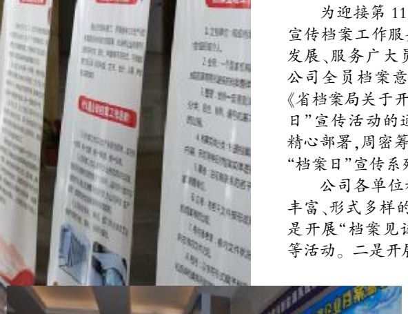
集成公司制作宣传展板