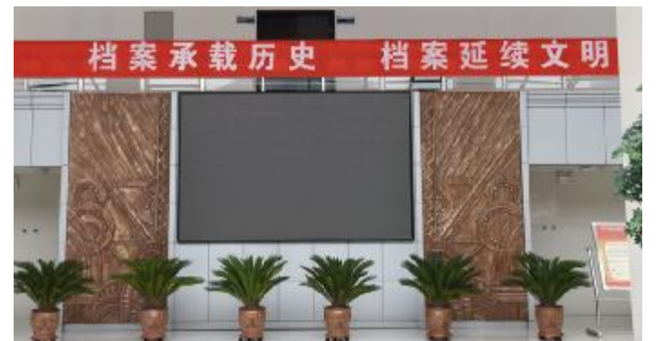
班电分公司悬挂宣传横幅