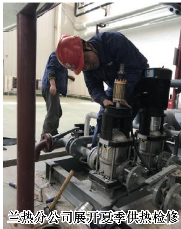
兰热分公司展开夏季供热检修